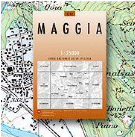
Kartenaktualität 1:25'000 (Stand: Nov. 2011)