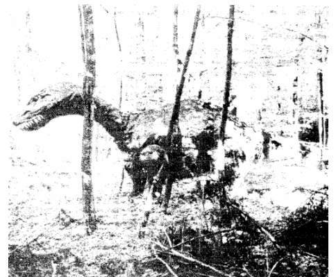
einer Traktoranhängvorrichtung war es uns möglich, das Ungeheuer in verschiedene Enden einzusetzen. Die Verschiebungen waren oft zum Erstaunen der Automobilisten ...