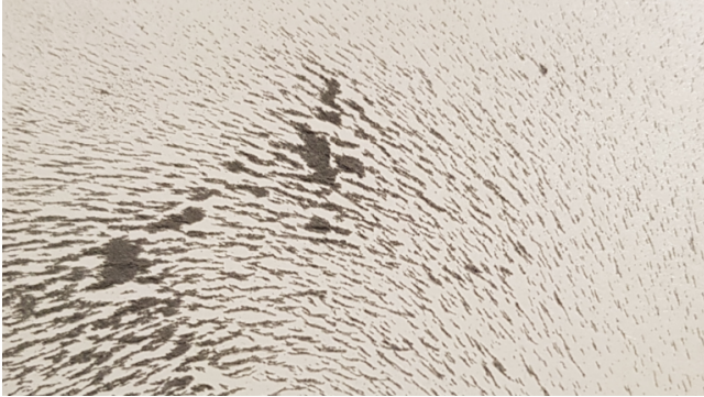
Feldlinien auf dem Karton

auch draussen in einem Teich viele solche Plasticfische hineingeben und ein Wettfischen machen.