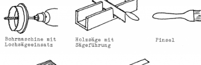
Bohrmaschine mit Lochsägeinsatz