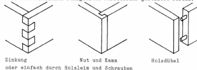
Zinkung oder einfach durch Holzleim und Schrauben

Die Eckverbindungen des Rahmens können je nach Perfektionsanspruch und nach handwerklichen Fähigkeiten verschieden gestaltet werden.