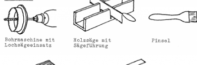
Bohrmaschine mit Lochsägeinsatz