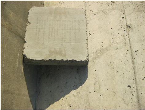
Das Betonieren und Beschriften von Betontafeln