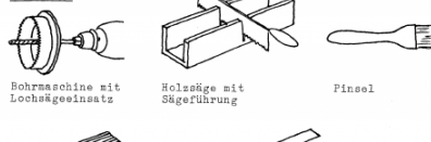
Bohrmaschine mit Lochsägeinsatz