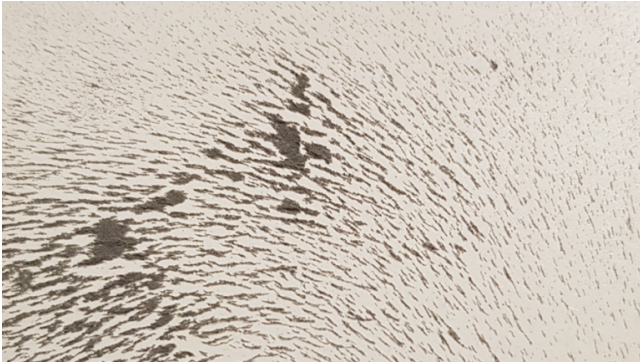
Líneas de campo en el cartón