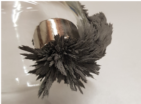
Imán en un vaso de precipitados, las limaduras de hierro forman formas maravillosas en el exterior