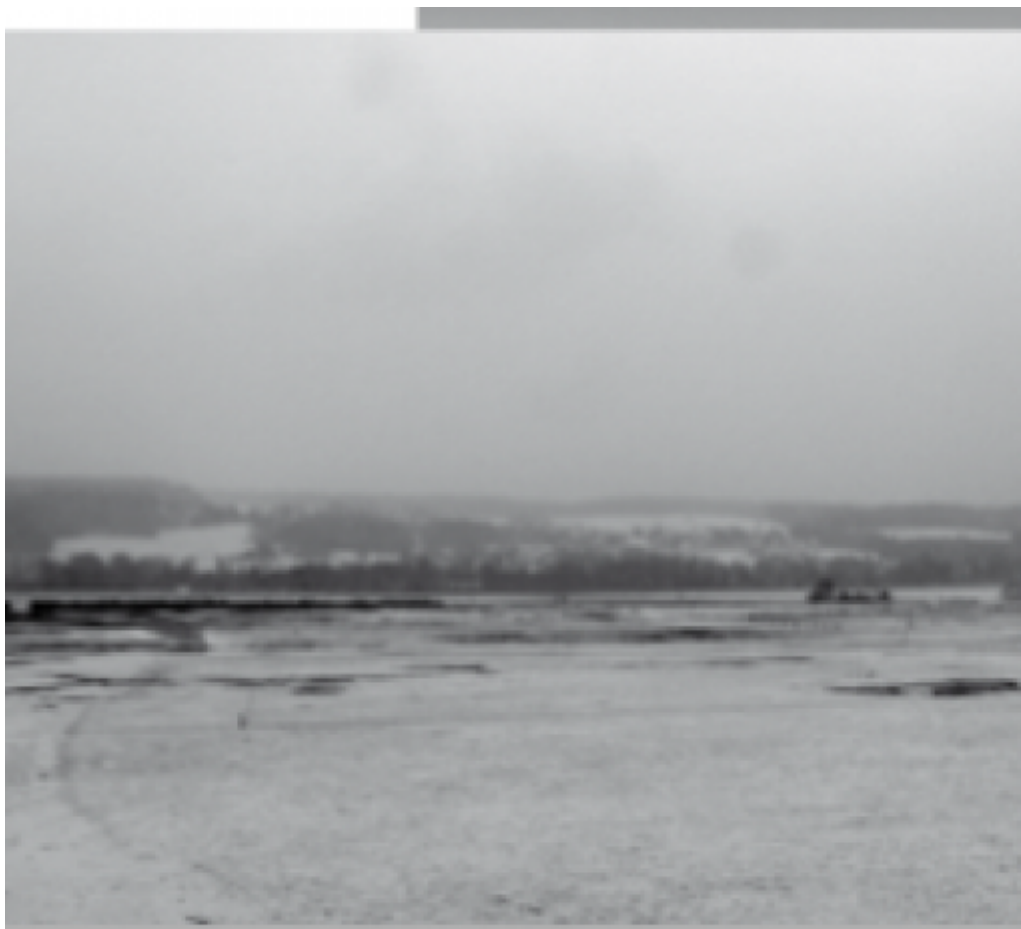
Stratus Hochnebel [meteoschweiz]