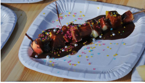
Csokoládéval bevont gyümölcsnyársak készítése