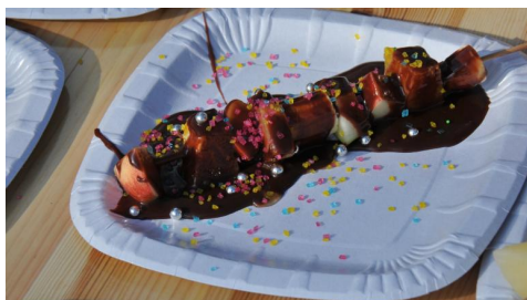
Csokoládéval bevont gyümölcsnyársak készítése