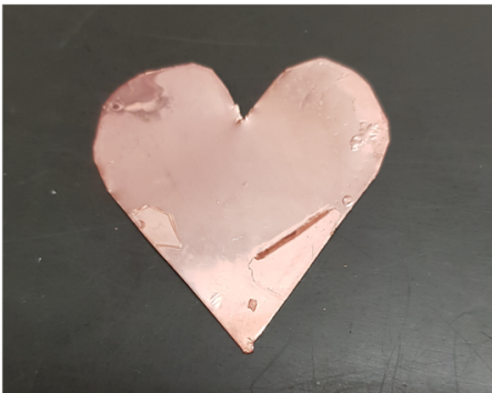
A megtisztított szív