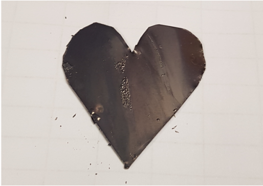
A rézszív megfeketedett