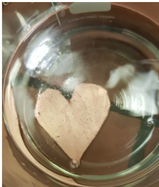
A forró szívet metilált szeszen tisztítják meg