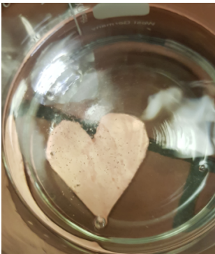
A forró szívet metilált szeszből tisztítják meg