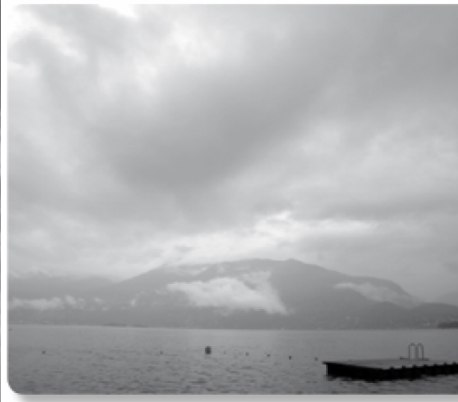
Stratus Schlechtwetter

Im obersten Stockwerk, bis zu einer Höhe von 5-7 Kilometern, entdeckt man schliesslich die Cirruswolken.