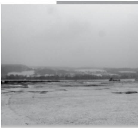
Stratus Hochnebel [meteoschweiz]