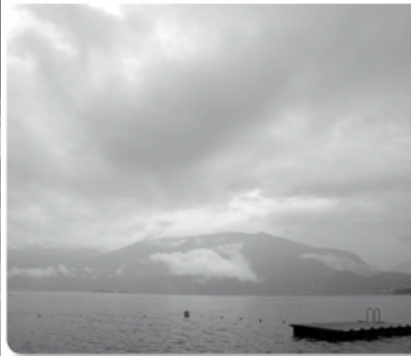
Stratus Schlechtwetter [meteoschweiz]

Im obersten Stockwerk, bis zu einer Höhe von 5-7 Kilometern, entdeckt man schliesslich die Cirruswolken.