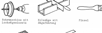
Bohrmaschine mit Lochsägeinsatz