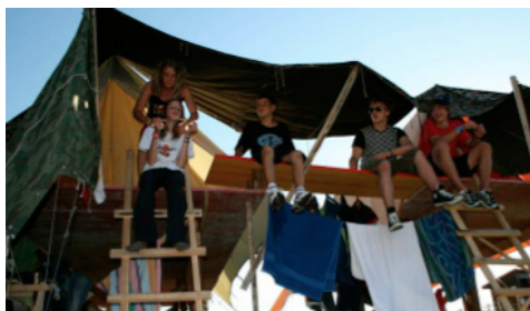
Ein Zeltlager zum Thema "Pfahlbauer".