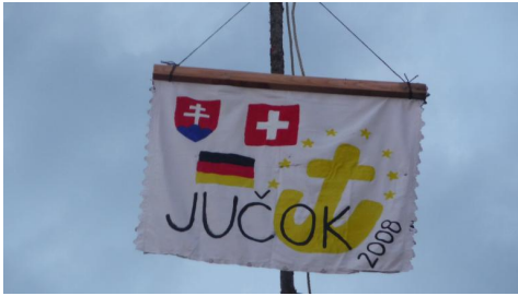
GLT_C1_Ideenbörse kreative Projekte_1

In dieser Ideenbörse möchten wir euch ein paar Ideen geben und euch dazu motivieren, selber kreative Ideen zu entwickeln. Für die Planung und Durchführung solcher Projekte lies die Unterlagen zur Projektleitung und missionarischer Ortsarbeit.