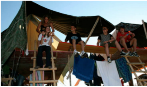
Ein Zeltlager zum Thema "Pfahlbauer".