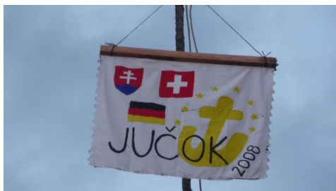
GLT_C1_Ideenbörse kreative Projekte_1

In dieser Ideenbörse möchten wir euch ein paar Ideen geben und euch dazu motivieren, selber kreative Ideen zu entwickeln. Für die Planung und Durchführung solcher Projekte lies die Unterlagen zur Projektleitung und missionarischer Ortsarbeit.