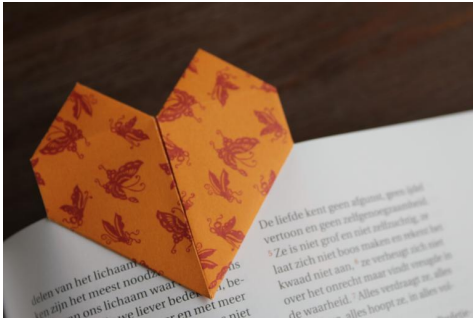
Zelf een boekenlegger maken