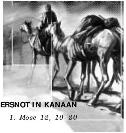
HUNGERSNOT IN KANAAN